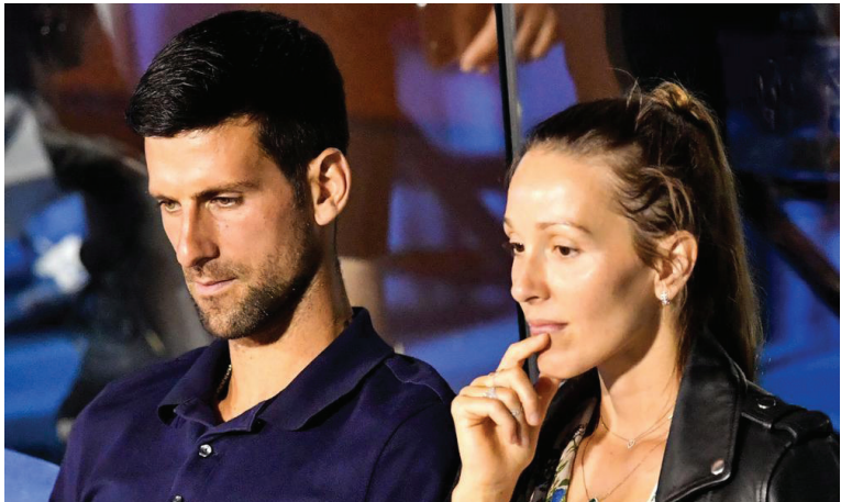
صربيا - وكالات

المكتب الاعلامي بأن نوكا وزوجته يخضعان لحجر صحي واتبعا ارشادات السلامة المتعلقة بكوفيد ١٩ منذ عودتهما من زادار (كرواتيا) قبل ١٠ أيام. وكان دجوكوفيتش أعلن في ٢٣ حزيران/ يونيو الماضي إصابته بفيروس كورونا بعد تنظيجه جولة استعراضية في منطقة البلقان لبعض نجوم كرة المضرب انطلقت في منتصف الشهر الماضي. وقد أصيب خلال هذه الجولة كل من البلغاري غريغور ديميتروف والكرواتي بورنا تشوريثش والصربي فيكتور ترويسكي. قبل أن يلحق بهم منظم جولة كرواتيا النجم السابق غوران إيفانيسيفيتش.