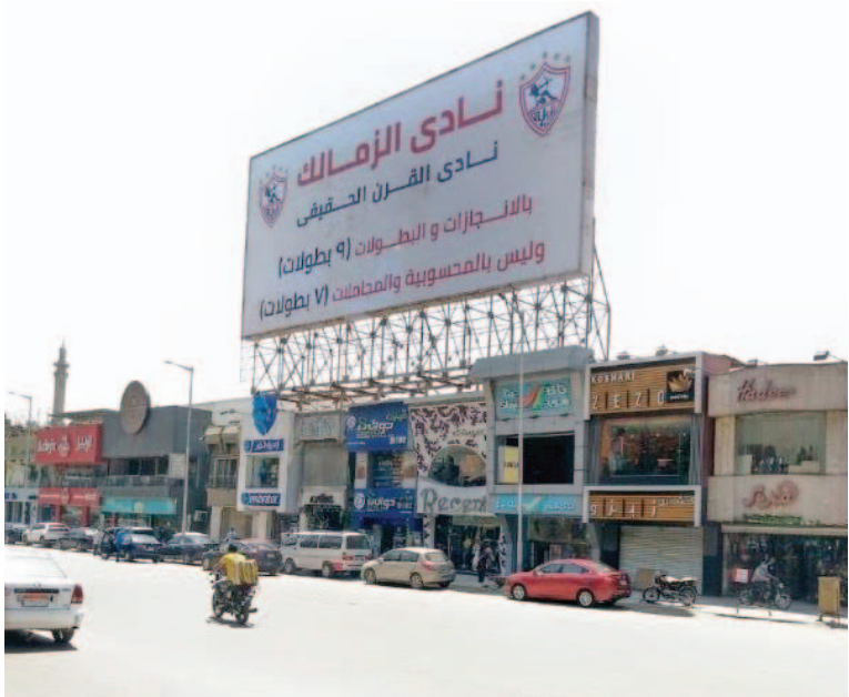
القاهرة - وكالات

بوضعها بمحيط ناديه وأعلى مبانيه. وأضاف "ما حدث بعد اعتداء صارخا على حقوق النادي الاهلي الفكرية (العلامة التجارية) والمسجلة بإدارة العلامات التجارية بوزارة التجارة والصناعة والتي اكتسبت حماية قانونية وفقا للمادة ٩٠ من قانون حماية الملكية الفكرية رقم ٨٢ لسنة ٢٠٠٢. ومازالت هذه العلامة تتمتع ببنات الحماية". وكشف بيان الاهلي "جاء في مذكرة الاهلي أن رئيس الزمالك تعدى على حقوق الاهلي بالمخالفة للوائح والقوانين، هو أمر ينذر بإشعال فتنة كبرى بين جماهير النادييين..