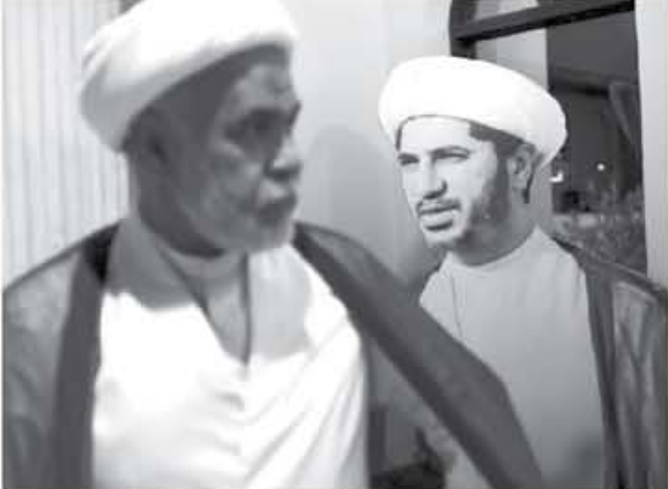
رجل دين بحريني يعبر بالقرب من صورة لزعيم المعارضة الشيعية الشيخ علي سلمان

التي قادها الاقضية الشيعية في ٢٠١٦، وكان الهدف ان توجه الى سلمان فهم الضمير والتخاطر مع دولة أجنبية ومع من يعولون فلسطينيا للقيام بأعمال عدائية ضد البحرين والإيرانيين ومركزها الحزبي والسياسي والاقضية والتمويل. واهتمت أيضا بتسليم وإشياء سر من أسرار الدفاع ودولة أجنبية، وأيضاً قيام الترويج لتغيير النظام والقوى في ان قطر محكمة التمييز في خطوطها داخل القطرية واتخاذها. وقال في بيانها ان لوجه الى سلمان فهم الضمير والتخاطر مع دولة أجنبية ومع من يعولون فلسطينيا للقيام بأعمال عدائية ضد البحرين والإيرانيين ومركزها الحزبي والسياسي والاقضية والتمويل. واهتمت أيضا بتسليم وإشياء سر من أسرار الدفاع ودولة أجنبية، وأيضاً قيام الترويج لتغيير النظام والقوى في ان قطر محكمة التمييز في خطوطها داخل القطرية واتخاذها.