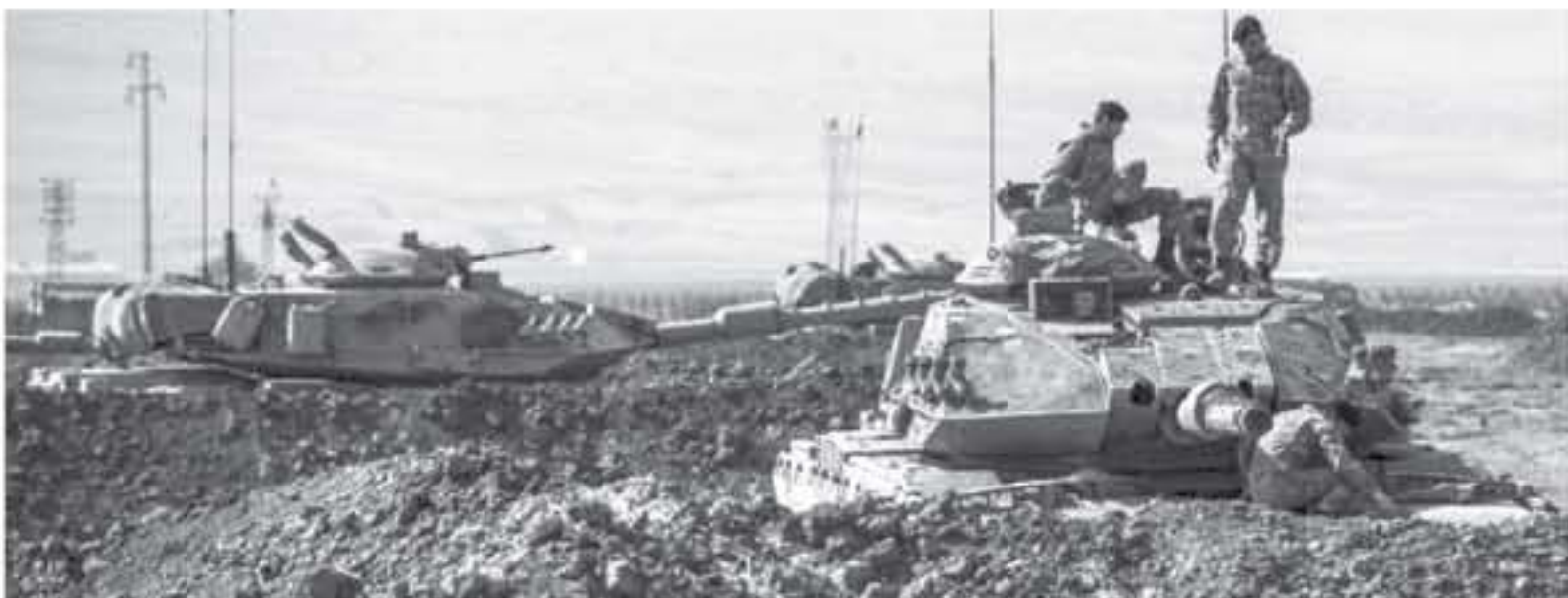
جنود وأليات تركية أثناء عمليات عسكرية قرب معبر الحابور الحدودي بين تركيا والعراق

الغارة - أ ك ب شنت طائرات حربية تركية أمس الأحد غارات لطعرة الثانية منذ بداية الشهر الجاري، استهدفت مناطق جبلية في كردستان العراق، قريبة من الحدود الإيرانية حيث يتواجد مشرقيون من أفراد أكرام تركيا وإيران بحسب ما أفاد مسؤول محلي. وقال قائد القوات الجوية العراقية ماركس حسن خبيص أمس في لقائه الثانية في غضون عشرة أيام، قامت طائرات حربية تركية بصفص جبال أرسوز التابعة لقضاء مارت على الحدود الإيرانية، التي تبعد ٥٥ كيلومتراً إلى شمال مدينة السليمانية، والتمسك بالحدود التي تحمل الاسم نفسه وأحد المحافظات الثلاث التي تشكل