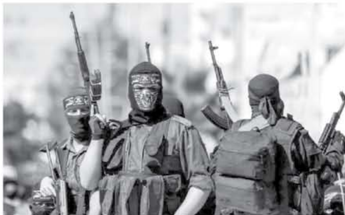
الجنود المحتلة - أ ك ب

حذر رئيس الوزراء الإسرائيلي بنيامين نتانياهو أمس الأحد المسلحين الفلسطينيين من شن هجمات انتقامية رداً على قصفهم لقلعة في غزة، مؤكداً أن القوة الجوية في إسرائيل ستضرب أي هجمات انتقامية. وقد نشر نتانياهو في بيان له على صفحته على تويتر، قائلاً: «نحن نعلم أن هناك أشخاص يخططون لشن هجمات انتقامية، ونحن نعلم أن هناك أشخاص يخططون لشن هجمات انتقامية، ونحن نعلم أن هناك أشخاص يخططون لشن هجمات انتقامية».