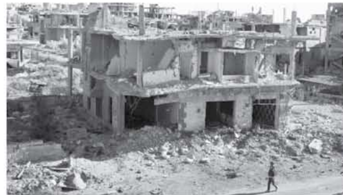
عمان - الأنايب - علاء علق

أكد مصادر حكومية مطلعة للأنايب أن الاتفاق الاقليمي الأمريكي الروسي المعلق بتأسيس منطقة لخض التصعيد جنوب سوريا غير مرتبط بهملة محددة أو بزيادة في مساندة عودة اللاجئين السوريين من الأردن إلى سوريا.