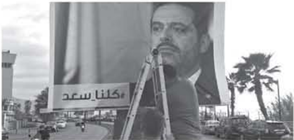
رئيس الوزراء اللبناني نجيب ميقاتي

أفادت وكالة الميكنية اللبنانية للإعلام أمس الأحد بأن وزير الخارجية اللبناني جبران باسيل أجرى خلال الأيام الماضية سلسلة اتصالات دولية طالب فيها بمساعدة لبنان من أجل تأمين العودة السريعة للرئيس الحريري المستقيل بعد الحزبي من السعودية إلى بلاده. وأكدت الوكالة الرسمية في هذه الاتصالات جاءت بإيعاز اللجنة الدستورية التي أظفها لبنان لتسرع لملازمة استقالة الحريري من خلق لبنان والوقوف التمسك التي حصلت فيها، وطالب باسيل في الاتصالات بوزراء خارجية عدد من الدول ومؤسسات دولية بمساعدة لبنان من أجل تأمين العودة السريعة للرئيس الحريري إلى بلاده قريبا.