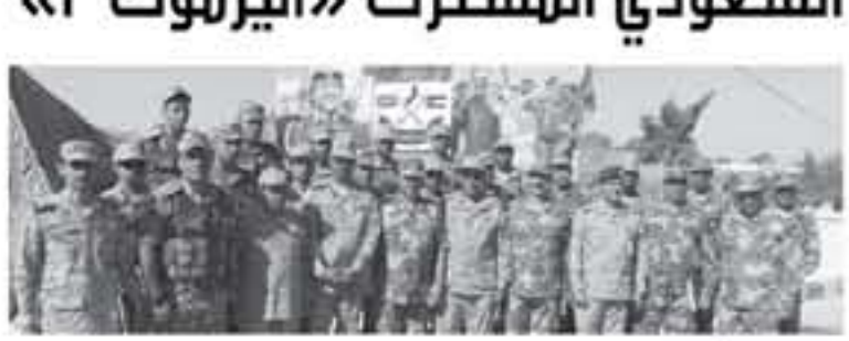
عمان - الأنايب

بدأت أمس فعاليات التمرين الأردني السعودي المشترك «اليرموك 2» في مدينتي التدريب بمشاريع القوات المسلحة الأردنية - الجيش العربي مع الجانب السعودي الشقيق بحضور عدد من كبار الضباط من الجانبين.